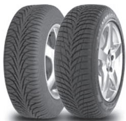
Van links naar rechts UltraGrip 6 UltraGrip 7+

Goodyear heeft banden die speciaal zijn afgestemd op winterse omstandigheden en snelle auto's inclusief modellen die tot 240 km/h kunnen halen.