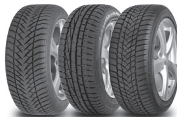
Van links naar rechts Eagle UltraGrip GW-3 UltraGrip Performance UltraGrip Performance 2